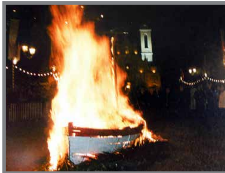
■ L'embrasement de la barque

« Enfin pour que le châtiment soit plus beau et pour donner un exemple complet, que le monde puisse se rappeler en tous temps, les Monégasques emmènent le bateau