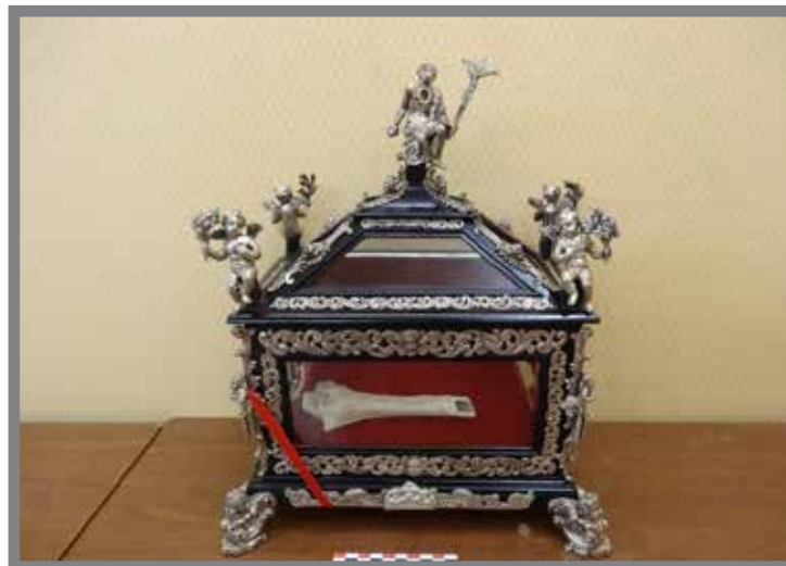
■ Reliques attribuées à sainte Dévôte présentées dans le reliquaire appartenant à Saint Jérôme (cf Passet 2011)

per dorme ün mezu d'ëli drünt'a päije, e ghe vöe stä e ghe stařä sügüřu finta che řu suriyu se faghe scüřu e che řa mařina sëche o che se täije. »