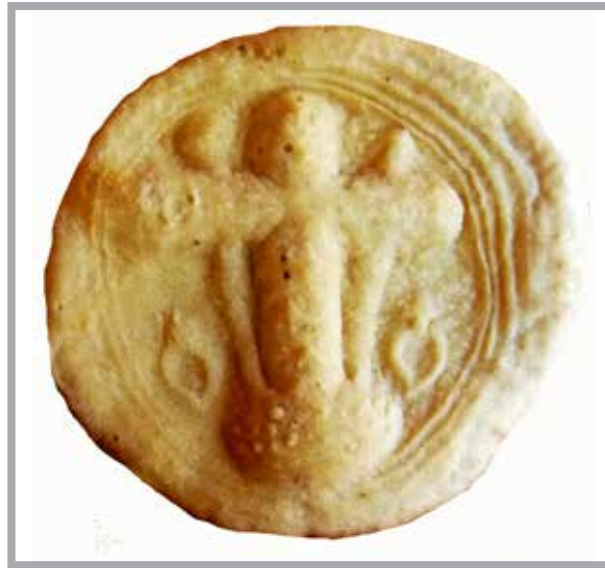
■ Pain béni distribué aux pénitents et aux fidèles à l'issue de la Procession du Vendredi Saint

A profescia d'u Cristu Mortu è stà restabilia. Â diferença d'a veyà profescia « mascarà », uramai se mima nüsciüna scena e a representaçion è menu ümpurtanta. U Venardi Santu, a cet'ure e meza d'a sëra, a profescia d'u Cristu Mortu representandu è principale scene d'u Calvari parte d'a Capela d'a Misericordia e, tra i antichi carrugi d'a Roca, s'üncamina versu a Catedrala cun u cantu d'u Miserere e a müsa d'una märcia fünebra. Achësta püsa profescia de l'Arcicunfreria d'a Misericordia, cina de devuçion e de fervü, ün mezu â gente sempre ciü racœyia, atesta ancura de ciü, ün achëstu anu giübilari d'a Misericordia, d'a staca d'i Munegaschi â so' fede religiosa e a ë soe tradiçie.